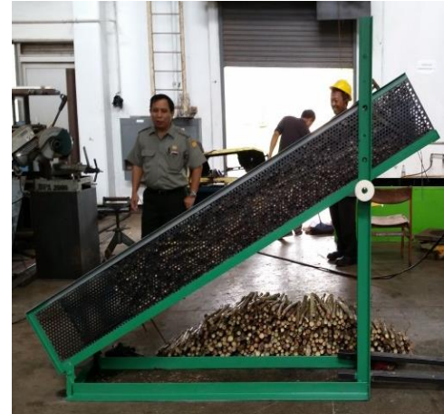
Gambar 3. Core sampler dan dudukan tebu siap giling untuk keperluan uji di BBP Mektan

Uji core sampler dilakukan dengan 4 tingkatan tekanan fluida hidrolik yang berbeda, yaitu 1000 psi (6.90 MPa), 1100 psi (7.58 MPa), 1200 psi (8.27 MPa), dan 1300 psi (8.96 MPa). Sebelum melakukan uji pengambilan sampel tebu, terlebih dahulu dilakukan uji fungsional mesin core sampler tebu untuk mengetahui